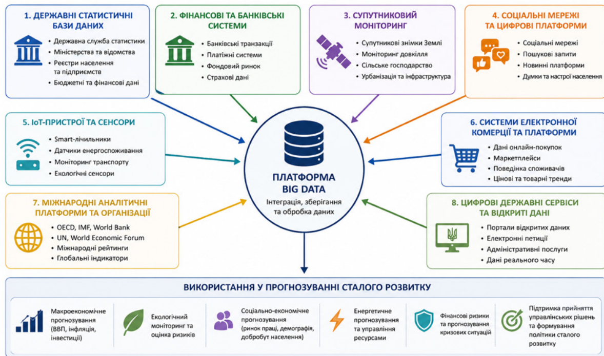
Рис. 2. Джерела Big Data у системі прогнозування сталого розвитку

Особливого значення набуває розвиток smart economy, що передбачає використання цифрових технологій для забезпечення ефективного управління ресурсами, розвитку smart city інфраструктури, ESG-моніторингу та підвищення конкурентоспроможності економіки [5].