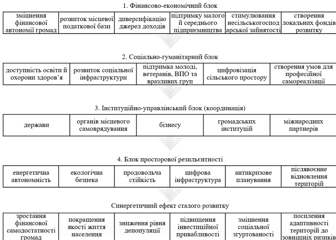
Рис. 2. Синергетична модель сталого розвитку сільських територій

Відтак, доцільним є впровадження синергетичної моделі сталого розвитку сільських територій, яка ґрунтується на принципі взаємного посилення фінансової спроможності громади та соціальної стабільності населення. Її концептуальна логіка полягає в тому, що фінансові ресурси не є кінцевою метою розвитку, а виступають базовим інструментом соціального відтворення людського капіталу, тоді як соціальна стабільність створює передумови для економічної активності та інвестиційної привабливості території (рис. 2). Основною функцією фінансово-економічного блоку є забезпечення ефекту фінансового замикання, коли значна частина доданої вартості залишається в межах територіальної громади та спрямовується на її внутрішній розвиток.