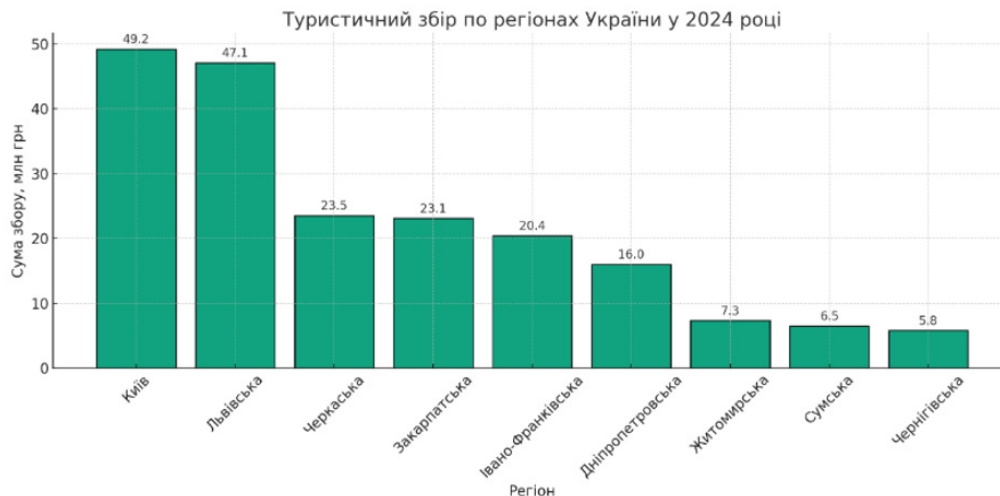
Рис. 2. Обсяги туристичного збору у 2024 році по ключових регіонах України

Згідно з офіційними даними, у 2024 році туристичний збір в Україні досяг 273,1 млн грн, що демонструє зростання на 16 % у порівнянні з 2021 роком [12]. Така динаміка вказує на поступове відновлення туристичної галузі, попри триваючі безпекові та економічні виклики. Як свідчить аналітика Державного агентства розвитку туризму, основні обсяги надходжень забезпечили Київ, Львівська, Івано-Франківська, Черкаська, Закарпатська та Дніпропетровська області (рис. 2).